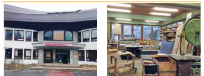
Holzwerkstatt der Rudolf Steiner Schule Bochum

Diese hochwertigen Produkte bestehen aus Holz aus nachhaltig bewirtschafteten Wäldern und werden mit Materialien verarbeitet, die unbedenklich für Mensch und Umwelt sind.